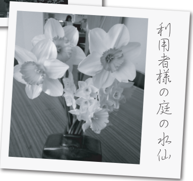
利用者様の庭の水仙